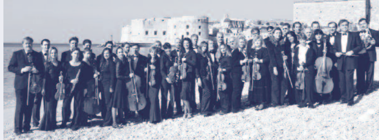
Dubrovnik Symphony Orchestra